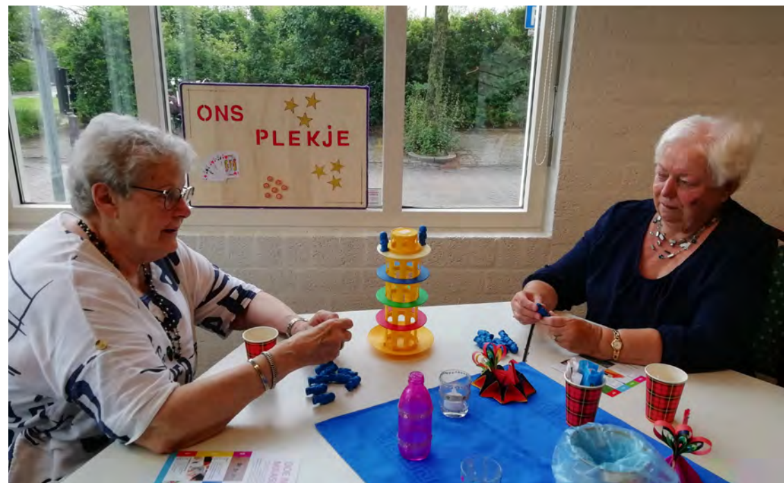
Open inloop, 'Ons Plekje!'