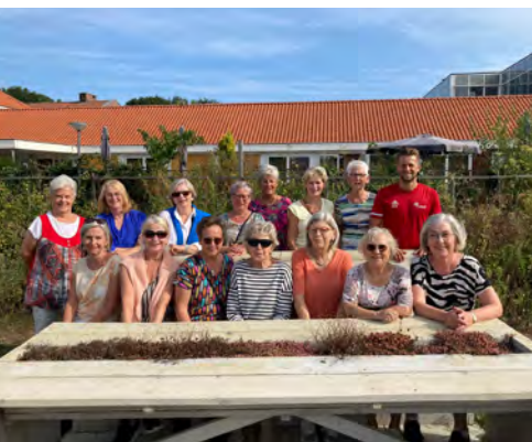
Wandelgroep Ammerzoden De Laاتبloeiers