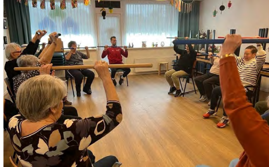
Bewegen vanaf je stoel Wijkhuis de Spellewaard

Praatje maken, bakkie doen, spelletje, biljarten, dammen, knutselen. Woensdag 13.30 tot 16.00 uur